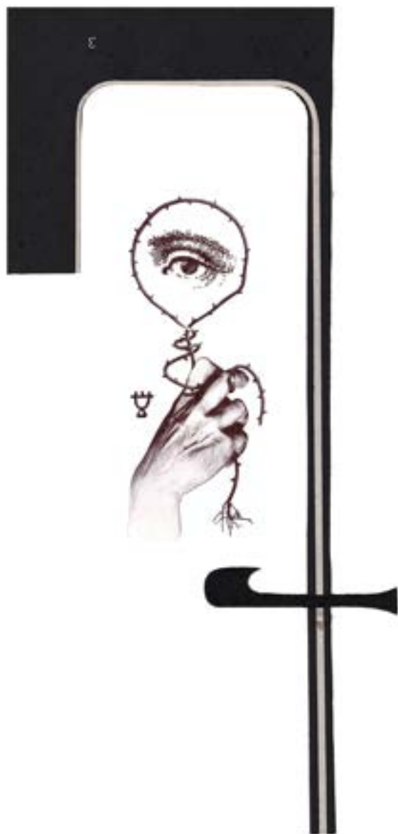
Z cyklu „Alchemia”