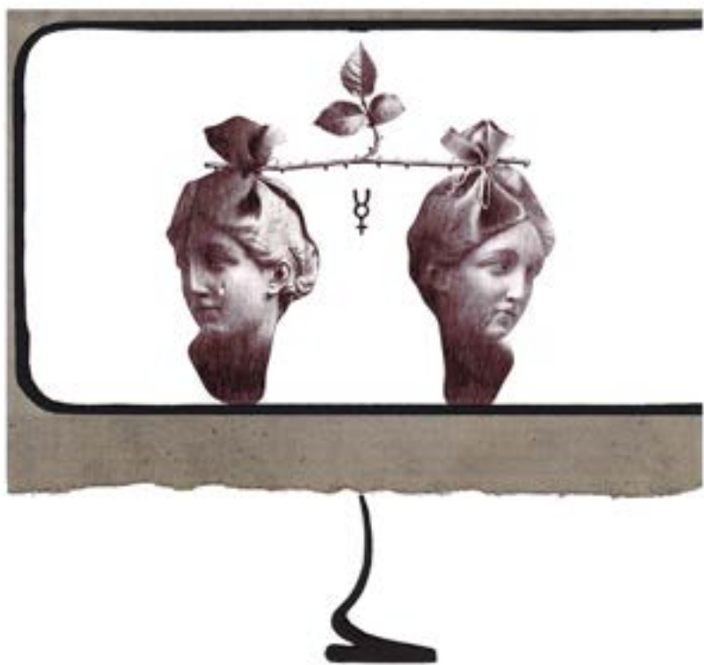
Z cyklu „Alchemia”