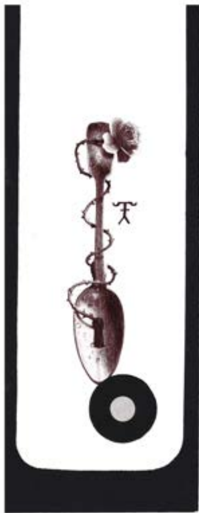
Z cyklu „Alchemia”