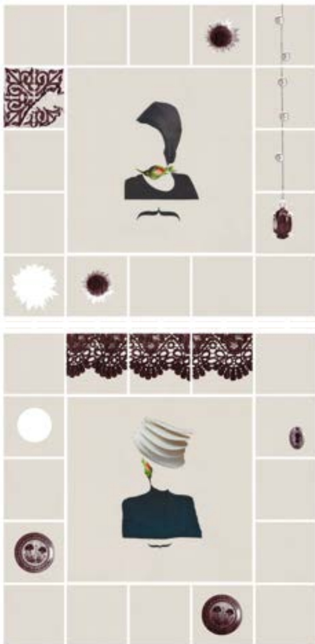
Z cyklu „Wdowy”