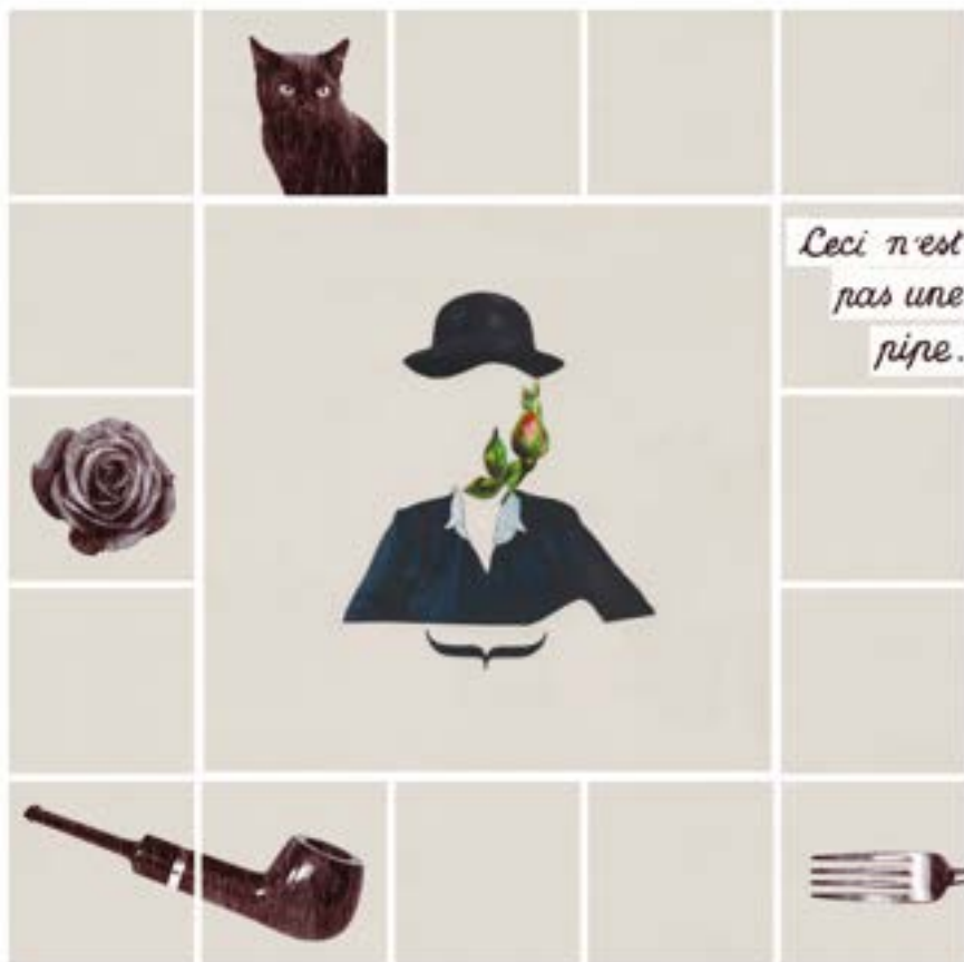
Z cyklu „Wdowy”